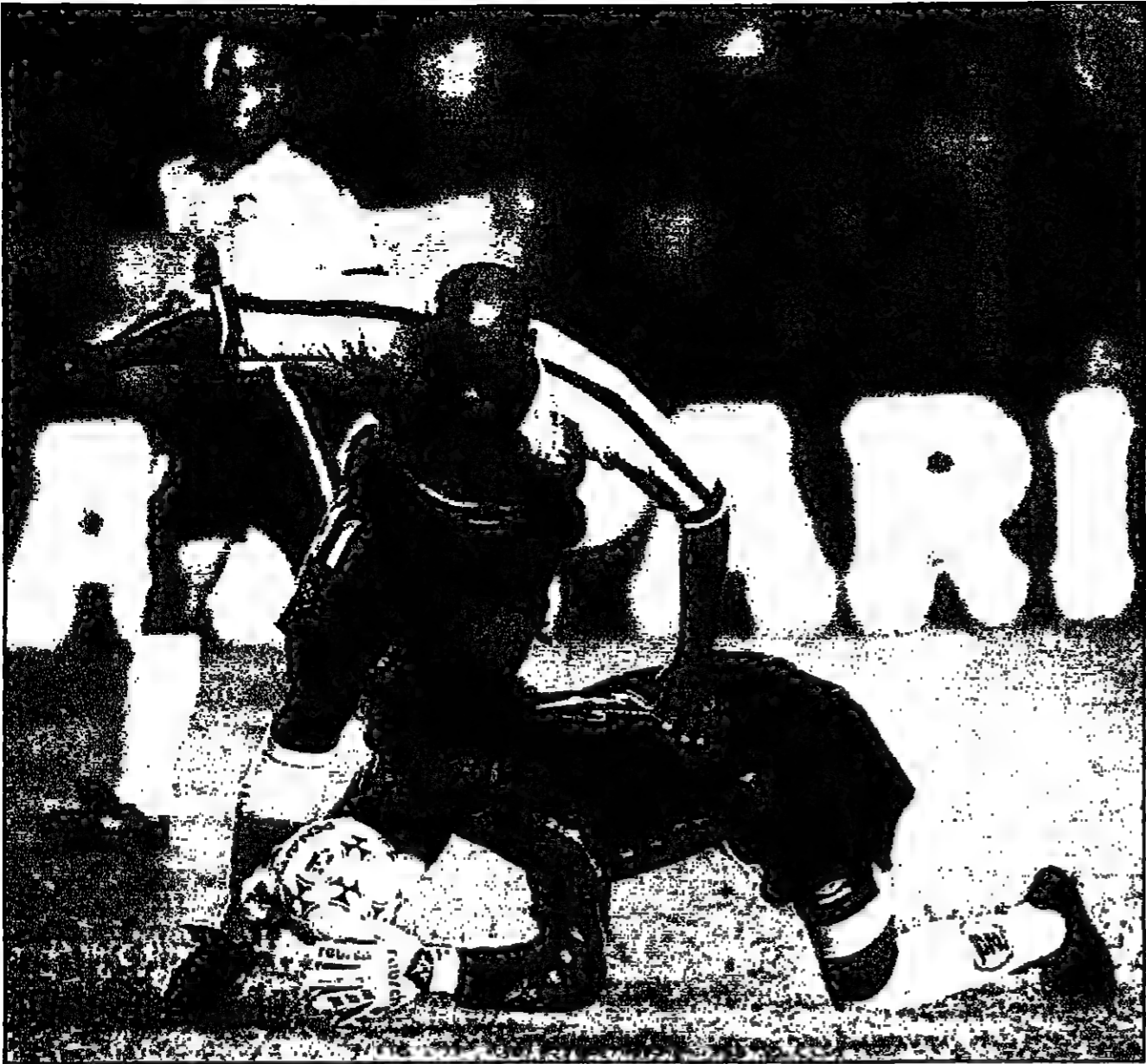
تجم البرازيل وبيرو في الدقيقة 90 من المباراة

تصافحت البرازيل وبيرو في نهائي كأس أمريكا لكرة القدم، وتقدم البرازيليون بعد دقيقتين فقط في صفر في مباراة رائعة من جانب واحد، وكان ليوناردو لاعب خط الوسط الذي سجل هدفين للقوة الحركية للبرازيل في حين سجل هدفين للهجوم روساريو هدفين قبل خروجه في الدقيقة 70 بعد ان اصيب بصدمة عضلية على ما يبدو، ومن المتوقع الا يشترك في المباراة النهائية يوم الاحد.